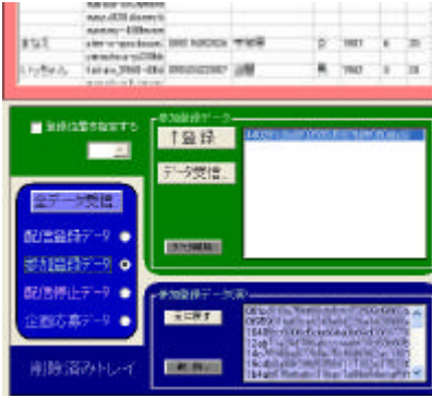
データの自動登録